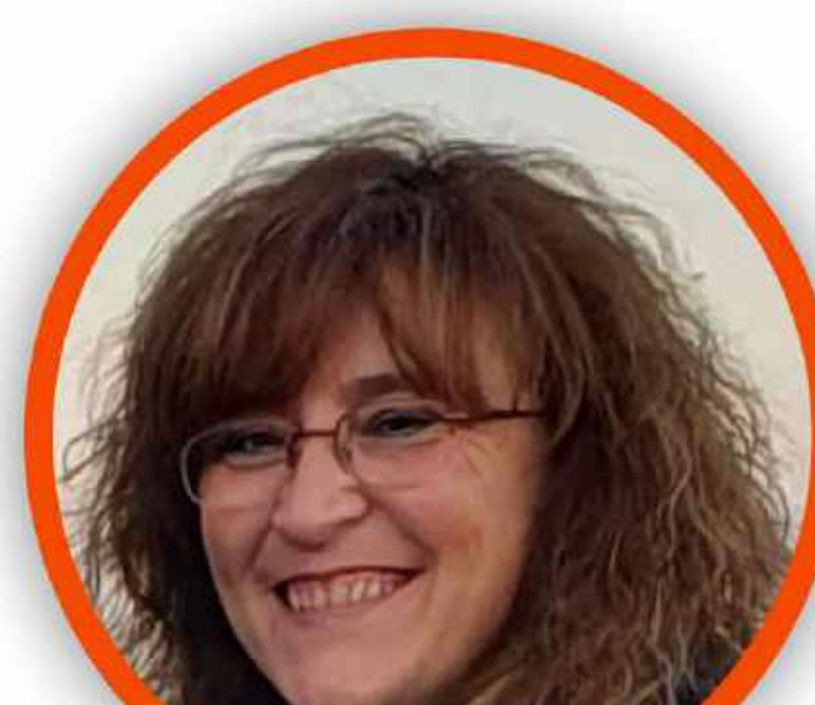
MARIANGELA MAPELLI SCUOLA PRIMARIA