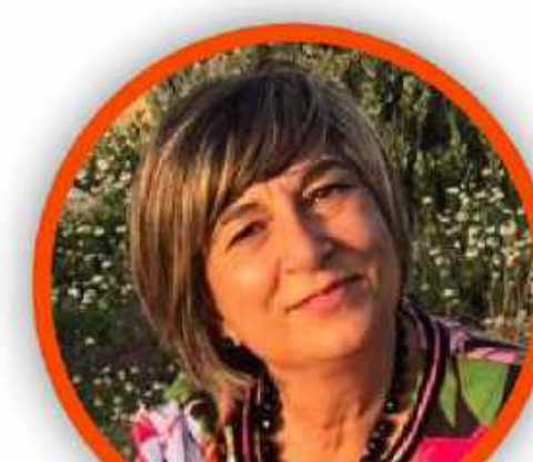
GIOVANNA MARIA BURRELLI SCUOLA PRIMARIA