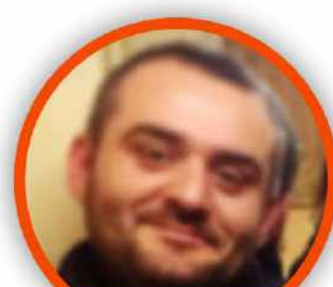
ROBERTO ZOLLO SCUOLA PRIMARIA